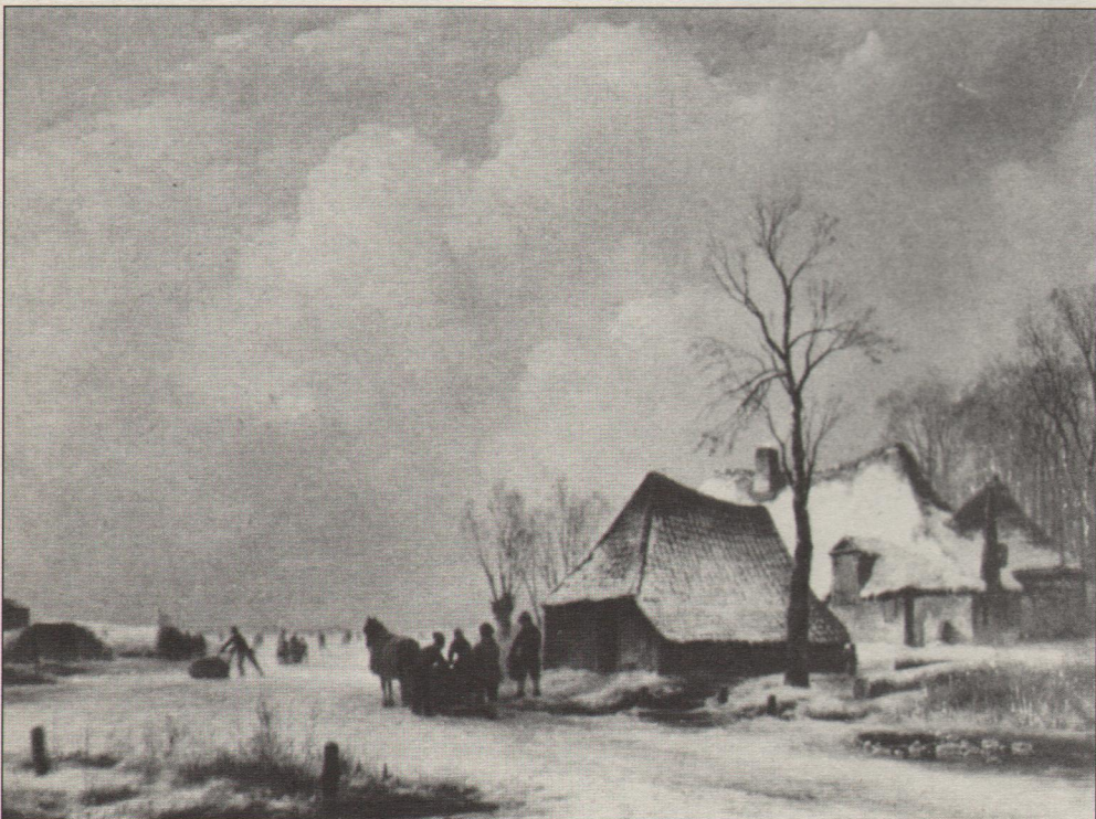
A. Schelfhout, Wintergezicht met figuren, paneel, gesigneerd, 36 x 48 cm.

Naast deze veiling zal op zaterdag 19 april in de Nieuwe Haven een historische show worden gehouden met materiaal van de Roei en Zeil.